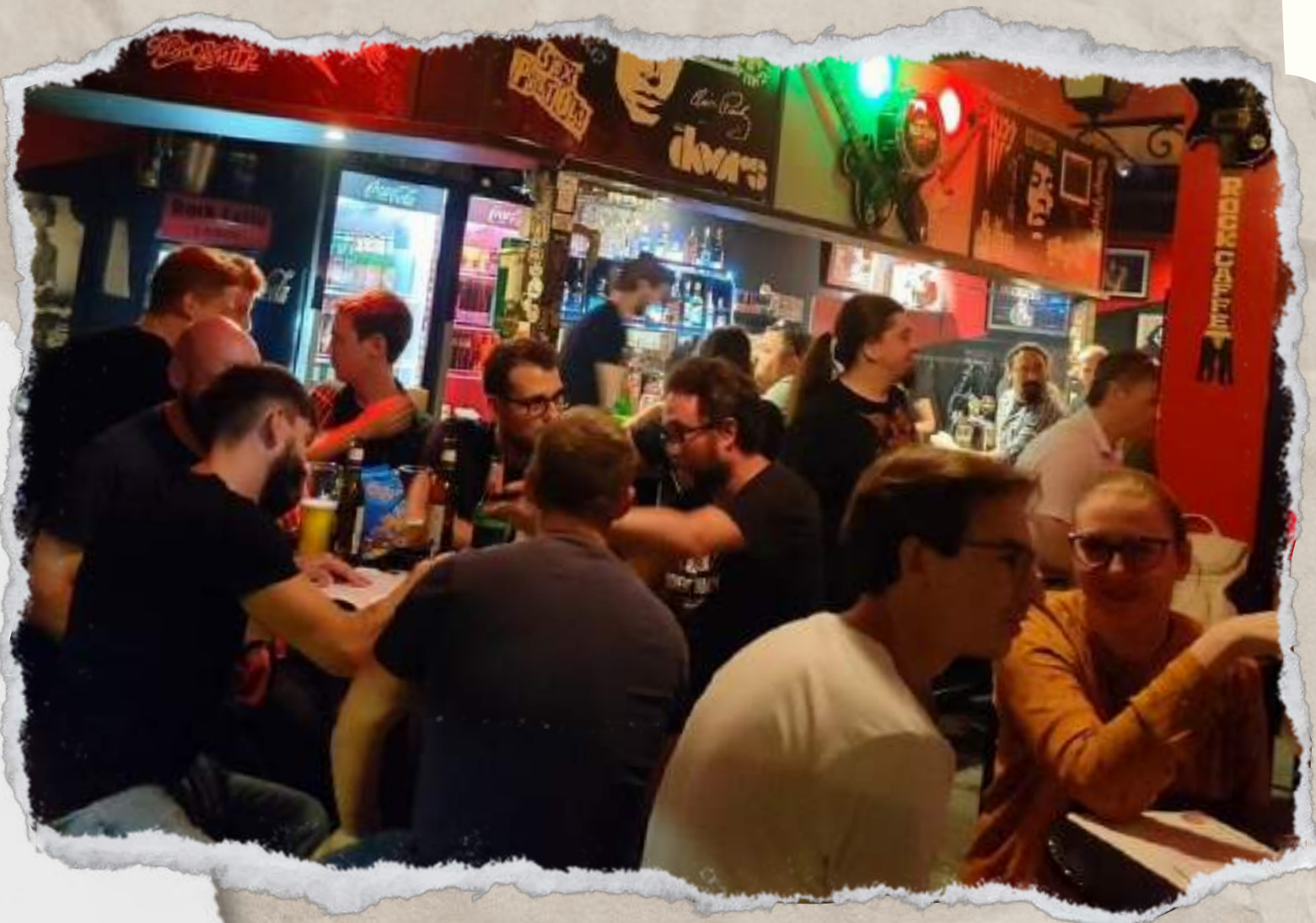
Rock caffe Labin, 12.10.2023.